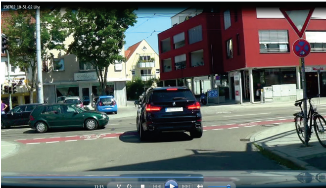
Videogestützte Erfassung der Verkehrs- und Parksituationen

Die Nach-Untersuchung sollte knapp ein Jahr nach Einführung der Regelungen die verkehrlichen Wirkungen analysieren und gegebenenfalls erforderliche Optimierungsmaßnahmen erarbeiten.