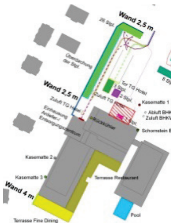
Wyk auf Föhr: Schallquellen und Lärmschutzanlagen

Dies hatte zur Folge, dass ein zweites Änderungsverfahren des Bebauungsplanes Nr. 31 durchgeführt werden musste. Im Rahmen dieses Verfahrens wurde die Verkehrsuntersuchung fortgeschrieben und in der schalltechnischen Untersuchung wurden die Lärmquellen des geplanten Hotels einer erneuten Überprüfung unterzogen.