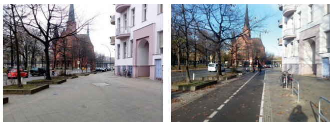
Planung und Ausführung eines Zweirichtungsradweges